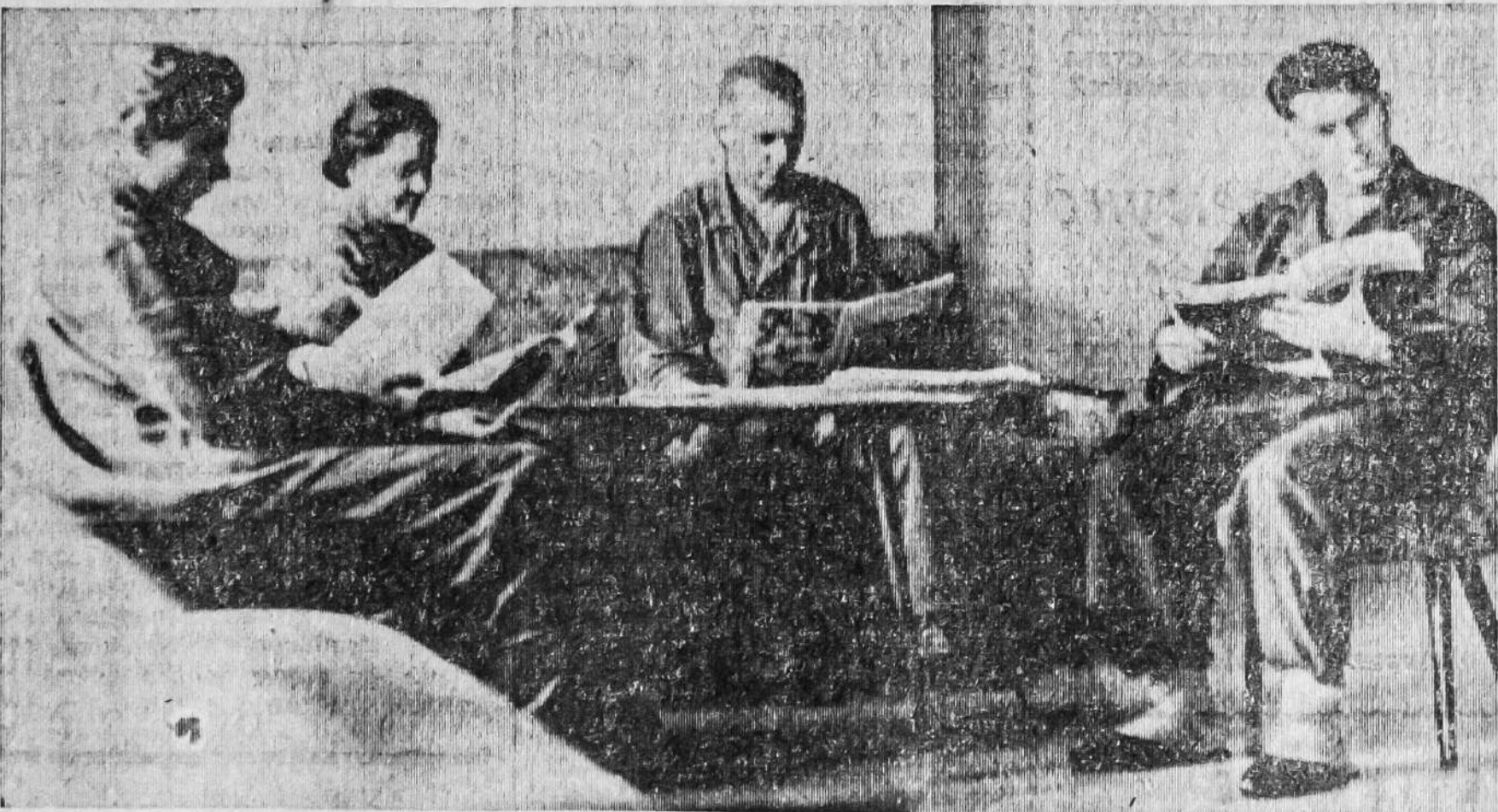
НА ВТОРОМ и третьем этажах в больнице есть уютные уголки отдыха. Здесь читают свежие журналы и газеты, вечером смотрят телевизионные передачи.

А тем временем жизнь в городе все дорожает. В августе, по последним данным бюро трудовой статистики, индекс потребительских цен поднялся еще на 0,4 процента, а за год — почти на восемь процентов. Кривая этого роста неуклонно ползет вверх уже в течение сорока месяцев. «Город», — признает газета «Нью-Йорк таймс», — не имеет ни плана, ни ресурсов, чтобы провести борьбу с бедностью». А. ЖИГУЛЕВ.