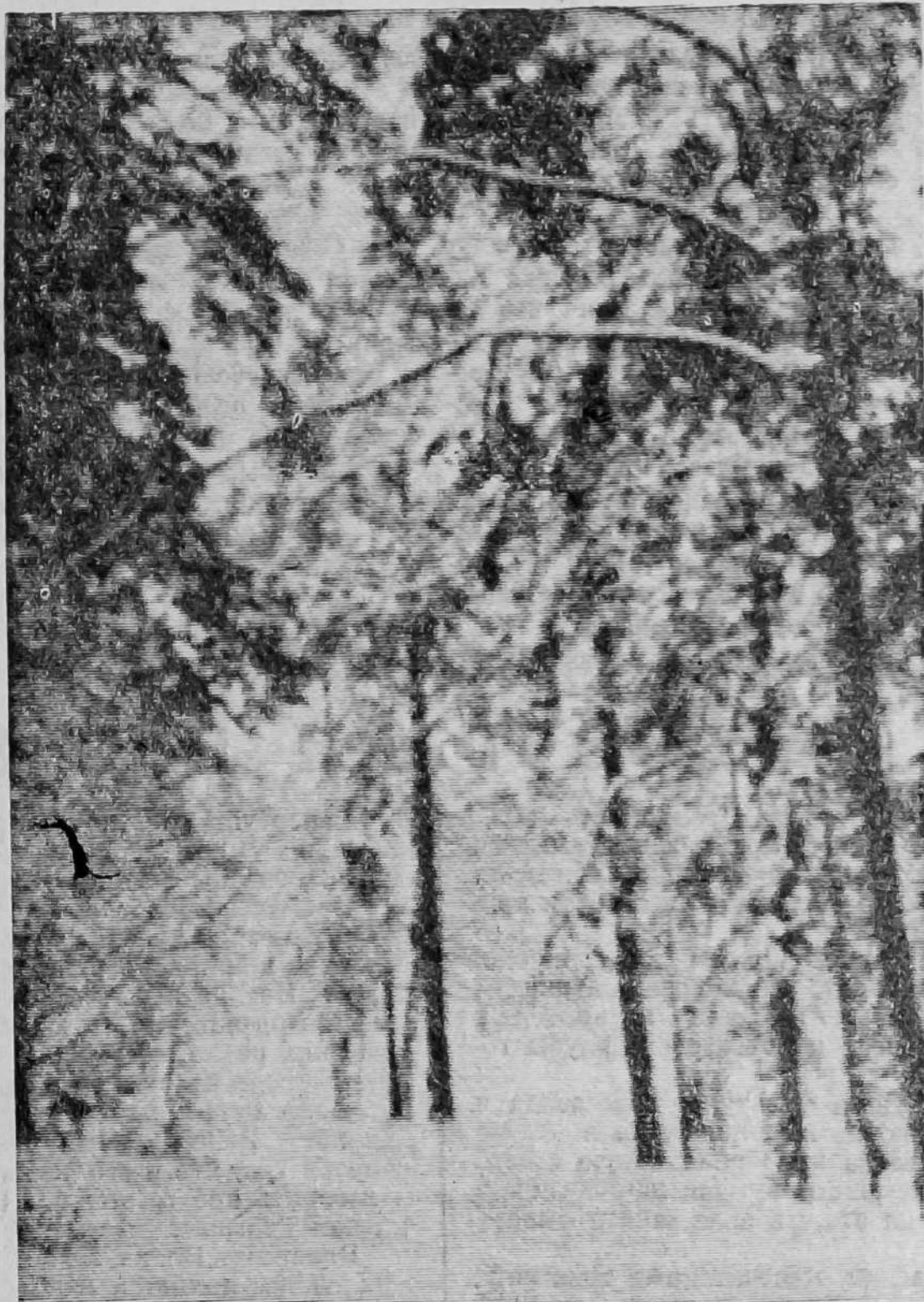
Ноябрь. В окрестностях Мнесса. Фотоэтиюд В. Самонвасова.

Была жена — повесили фашисты, Был сын — убили под Орлом. А он — живой, вернулся утром мгlistым В свое село и не нашел свой дом. Не захотел (а, верно, было б можно) Жениться вновь, отстроить снова дом. С тех пор он в общежитии молодежном Прописан постоянно бобылем. В «коммуна» вкладывая часть зарплаты, Закону дружбы подчиняясь без слов. Живет отец убитого солдата С ребятами, не знавшими отцов. И есть, наверно, смысл особый в этом: Зовет их сыновьями он, а те, Нарушив грубо нормы этикета, Его — на «ты» и попросту — «отец». В. ВАСИЛЬЕВ.