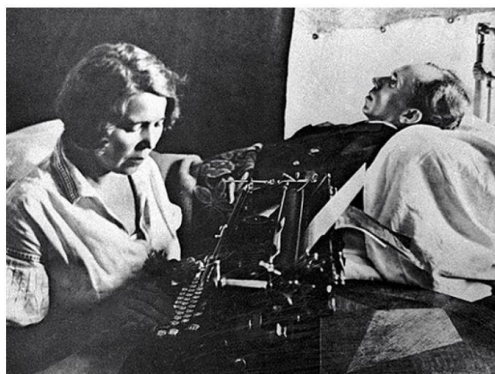
ПИСАТЕЛЬ НИКОЛАЙ ОСТРОВСКИЙ ДИКТУЕТ ГЛАВЫ РОМАНА «РОЖДЕННЫЕ ВУРКА».

Поселились в «полукомнате», наспех отгороженной от соседей досками. Обстановку составляли старая железная кровать, старый ломберный столик, стул, ещё одна кровать, сооруженная из ящичков и досок, и ещё два стула из чурок. Уходя на службу, жена оставляла лежачего мужа одного в закрытой, от любопытных соседей, комнате многолюдной коммунальной квартиры.