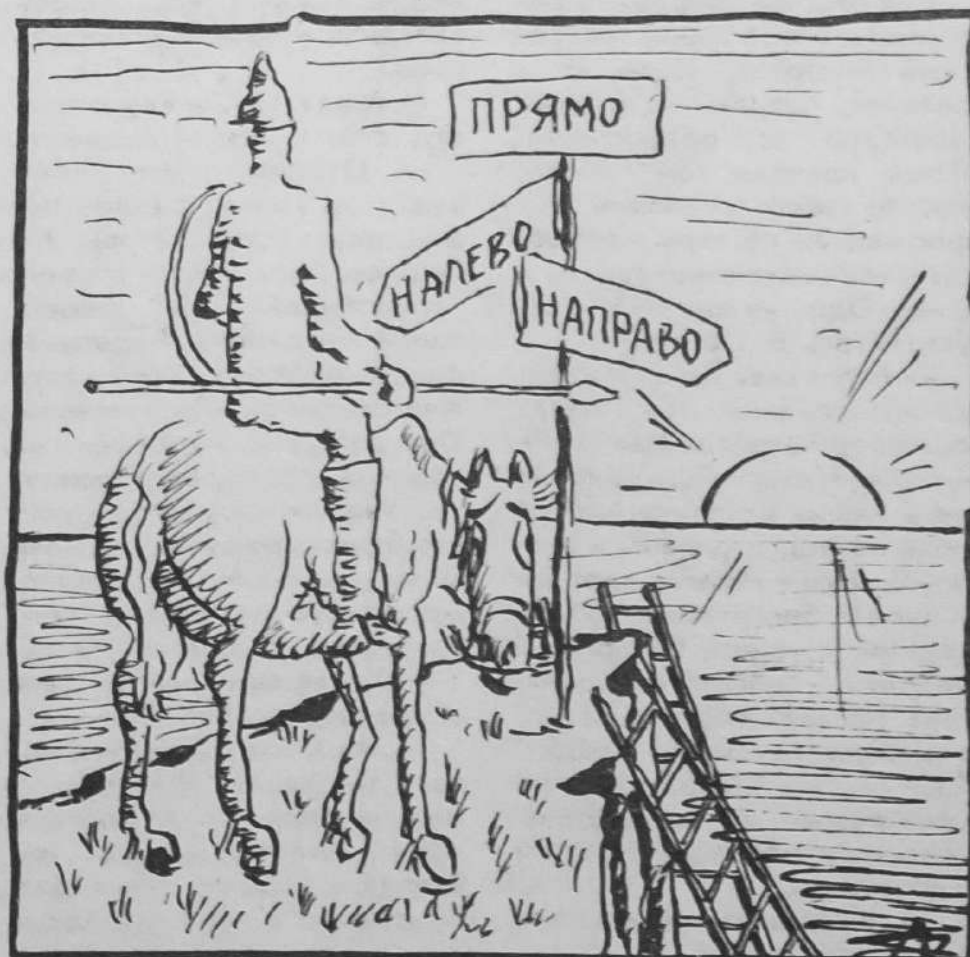
Рис. А. Дернова.