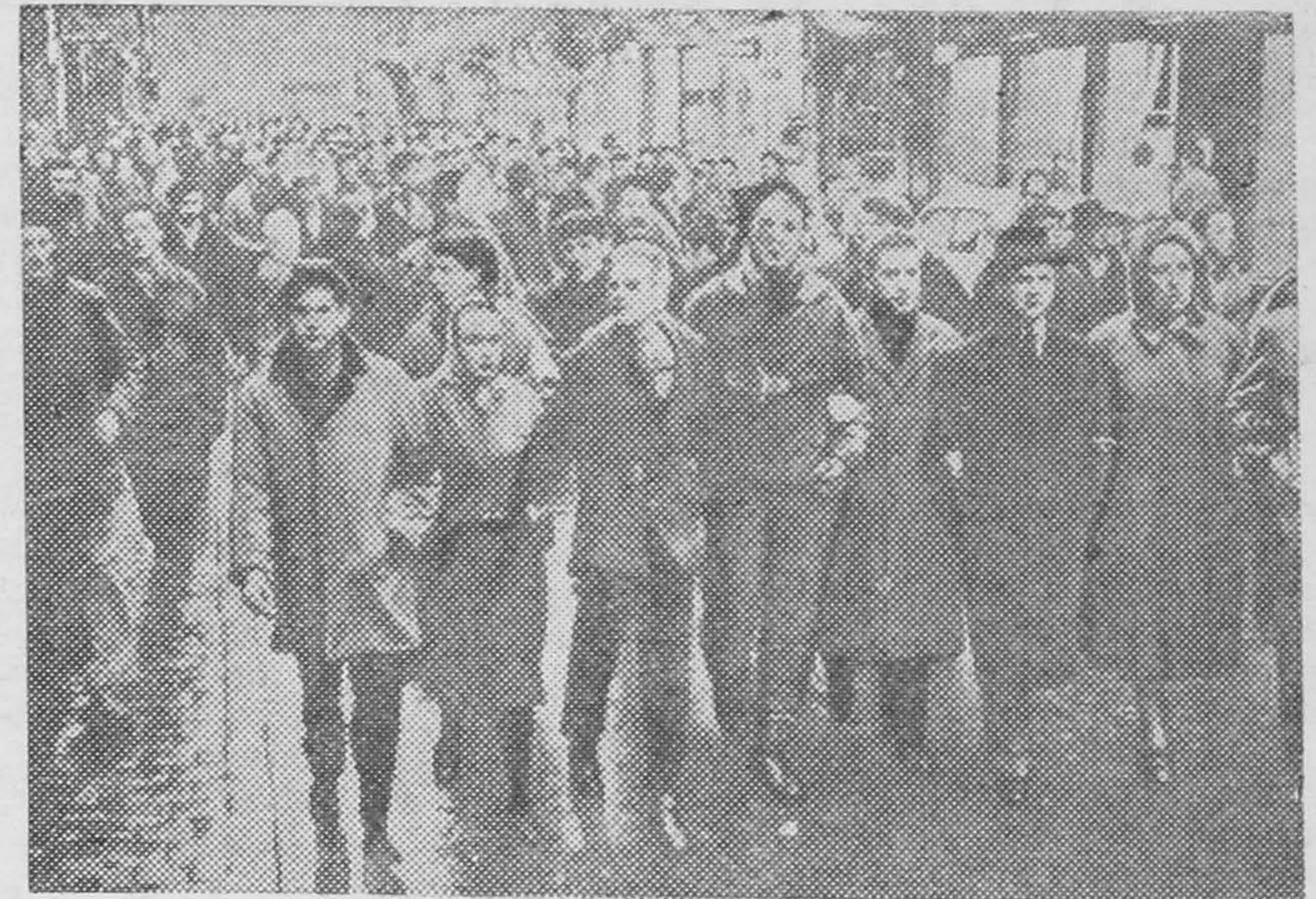
Недавно Всесоюзная федерация труда Бельгии провела в стране 24-часовую забастовку в поддержку требований трудящихся о повышении заработной платы и улучшении условий труда. В городах Бельгии прошли митинги и демонстрации. На снимке: бастующие на улицах Брюсселя.