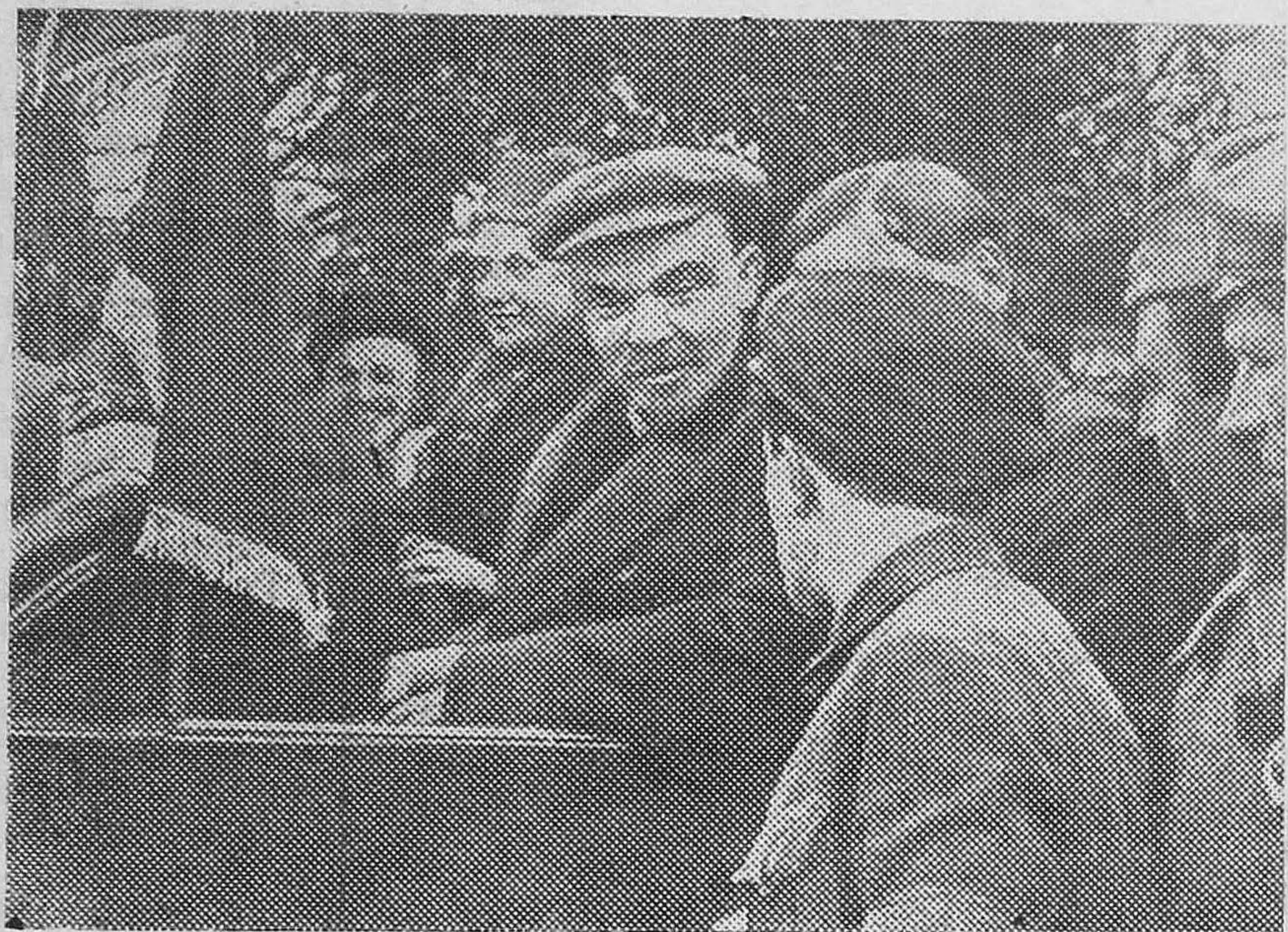
Кадр из фильма «Воспоминания о В. И. Ленине». В. И. Ленин и Н. К. Крупская у рабочих Рублевской водоканалки. 1 мая 1919 года.