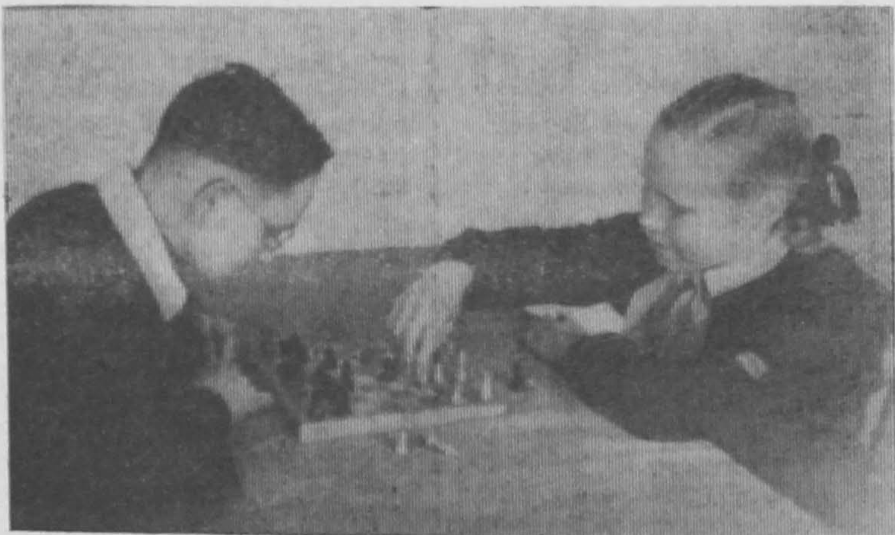
Юные шахматисты.