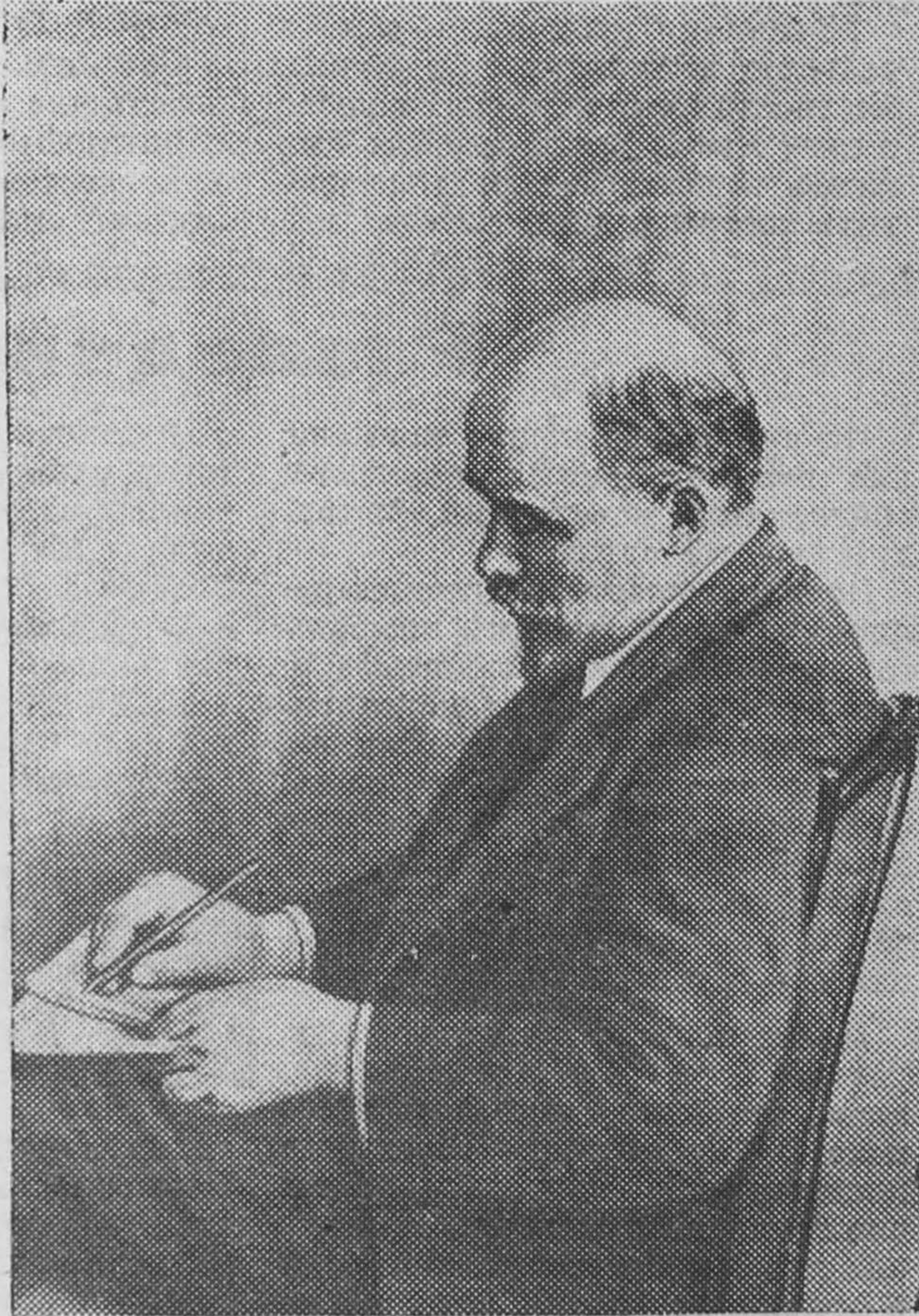
В. И. Ленин на конгрессе Коминтерна.