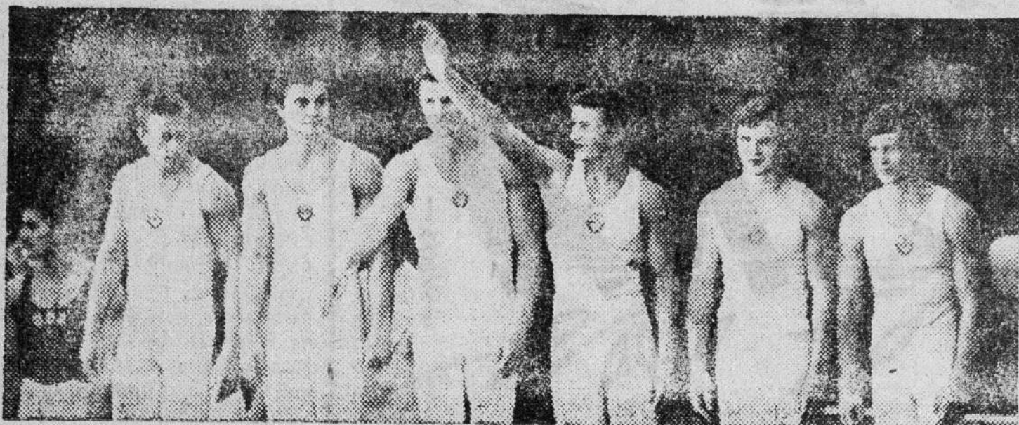
МОСКВА. Дворец спорта в Лужниках. Гимнастика. В командных соревнованиях среди мужчин советские спортсмены завоевали первое место. НА СНИМКЕ: олимпийские чемпионы

в командном первенстве (слева направо) Николай Андрианов, Эдуард Азарян, Александр Дитятин, Богдан Макуц, Владимир Маркелов и Александр Ткачев.