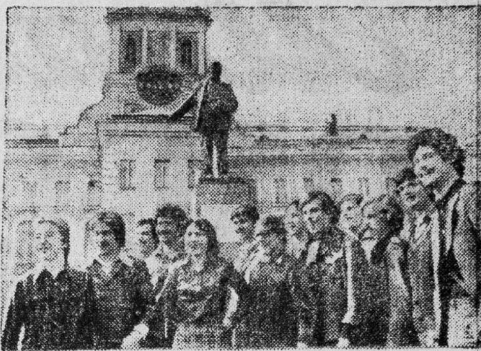
ЛЕНИНГРАД. Большое внимание в объединении «Невский завод имени В. И. Ленина» уделяется профессиональной ориентации молодежи. С этой целью действует отдел технического обучения. Свои первые шаги молодые машиностроители делают под руководством опытных наставников.

НА СНИМКЕ: группа молодых машиностроителей.