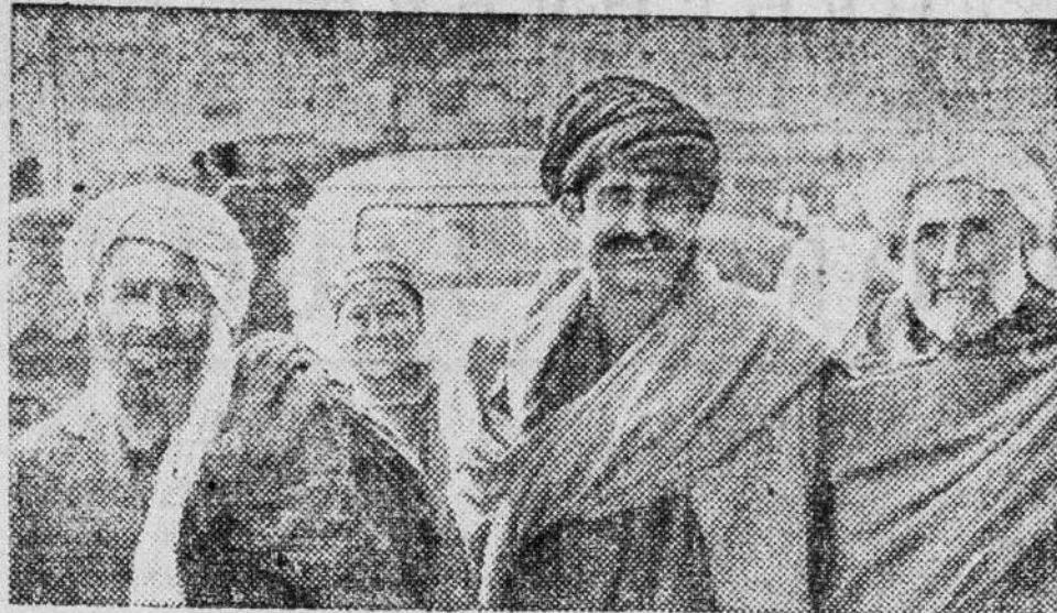
АФГАНИСТАН. Труженики полей горячо приветствуют прогрессивные преобразования в стране и, в первую очередь, на селе.

Народное правительство объявило о повышении закупочных цен на некоторые виды сельскохозяйственной продукции, на льготных условиях предоставляет крестьянам удобрения, высокоурожайные сорта семян зерновых, технику.