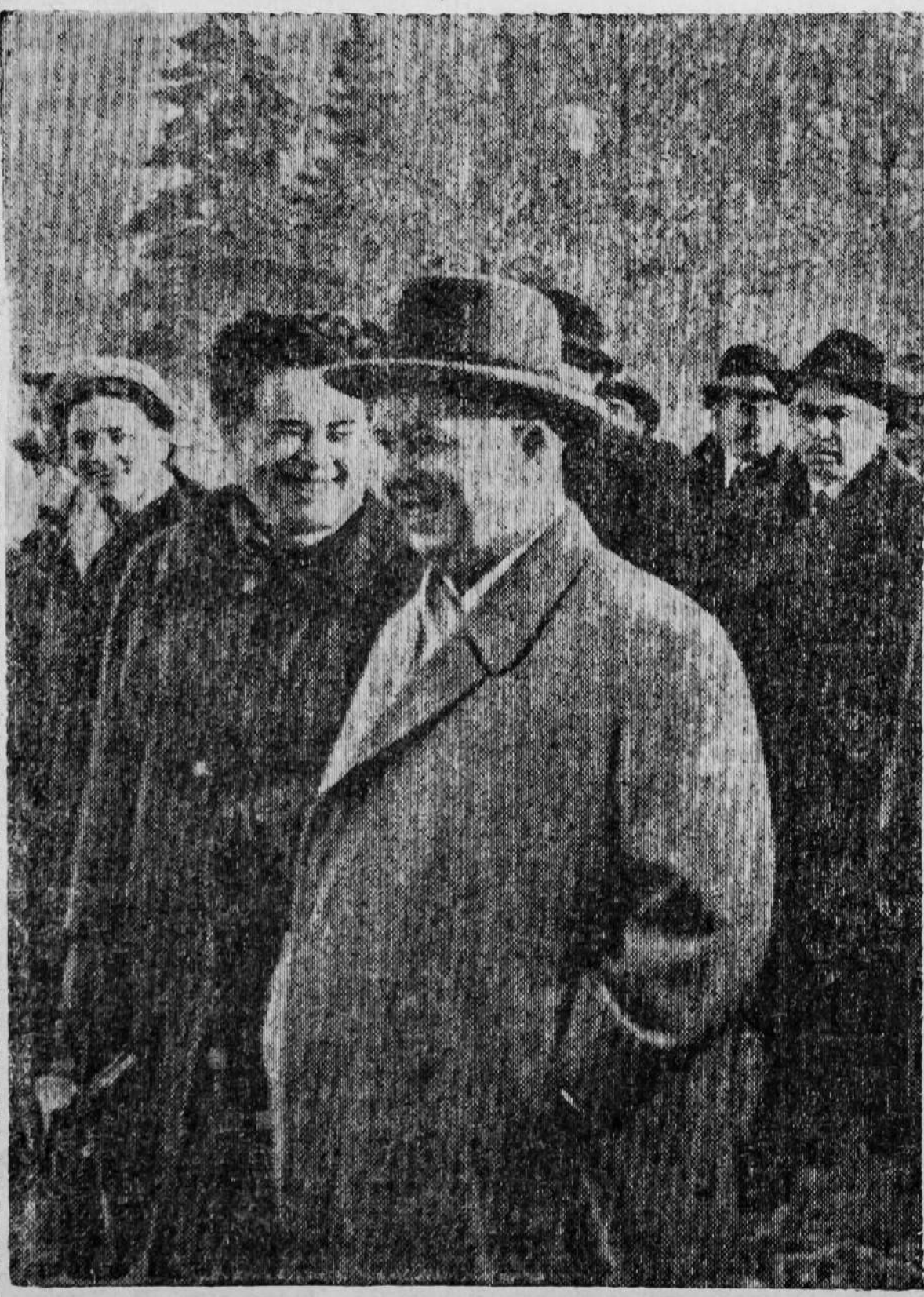
XXII съезд КПСС. Товарищ Н. С. Хрущев среди делегатов съезда.