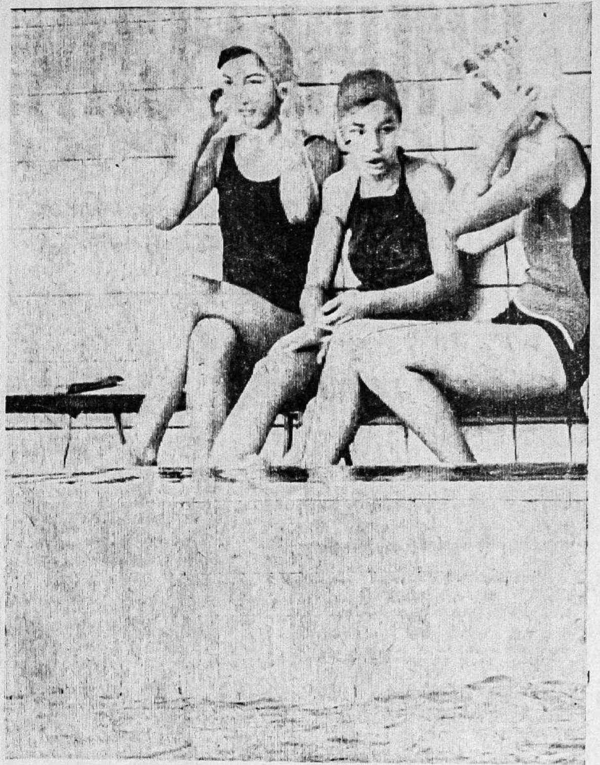
ЮНЫЕ ПЛОВЧИХИ

В. УСОЛЬЦЕВА, работник библиотеки имени Ю. Н. Либединского.