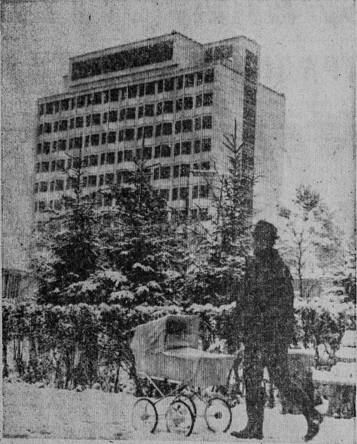
МОЛОДЕЕТ НАШ ГОРОД.