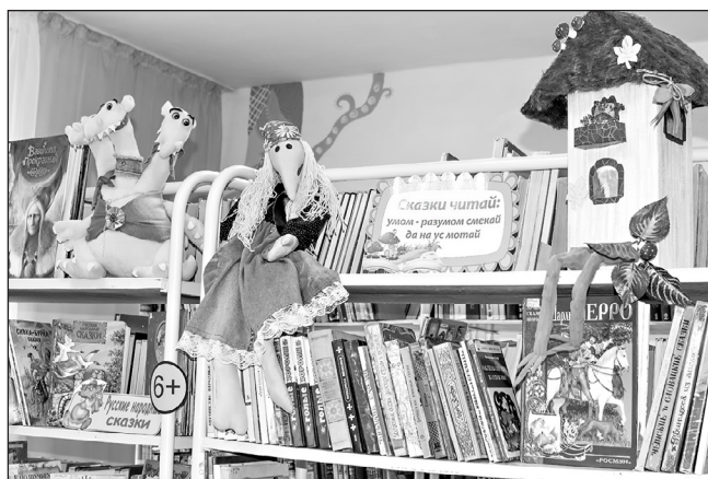
...и наряды кукольных героев, например, стильная юбка Бабулички-ягулички

Особое место в пространстве занял маленький чемодан, сделанный из денима. По сути, это готовый набор для проведения библиотечного урока в детском саду. Внутри мы поместили несколько десятков книжек, содержащих удивительные истории