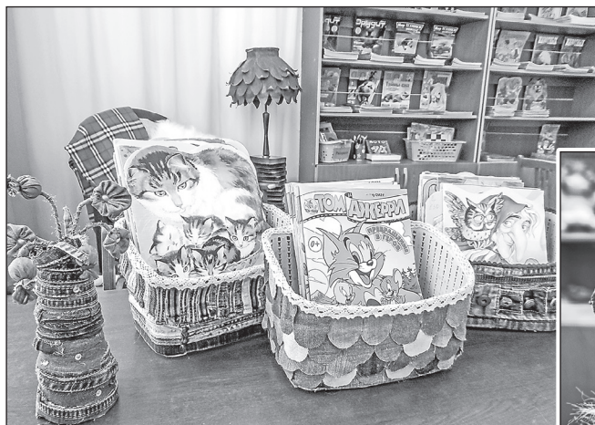
■ Джинсовая ткань идеально подходит для рукоделия. Из неё получаются оригинальные книжные короба...