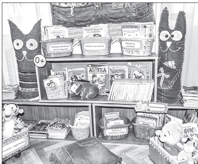
■ Очаровательные мягкие котики оживляют уголок чтения для малышей

новые идеи», «Рукам работа — душе радость» и др. Таким образом мы показали, насколько органично сочетаются любовь к искусству, литературе и желание быть стильным. Как выяснилось, чаще всего ребята выбирали сочинения современных писателей, в том числе Олега Роя, Холли Вебб, Станислава Востокова. Собрал их на экспозиции «Самые популярные книги» в зале абонементного обслуживания, мы убедились в востребованности изданий — экземпляры разобрали очень быстро.