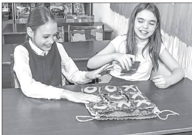
■ Из денима можно пошить даже комплект настольной игры! Сразиться в «Крестики-нолики» захочется каждому

Затем мы изготовили гусеницу-карандашницу Юсю. Выполненный из цветной джинсы и консервных банок органайзер высоко оценили любители творчества. Ведь это и система для удобного хранения канцтоваров, и оригинальный элемент декора рабочего пространства.