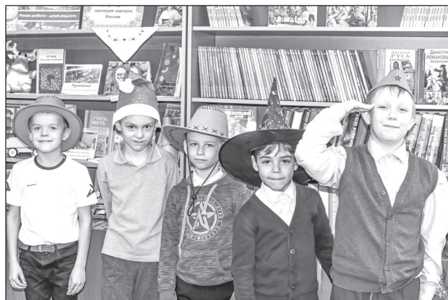
■ Каждый участник мероприятия «Всё дело в шляпе» нашёл головной убор себе по душе

Ряд событий был организован по договорённости с педагогами, с которыми сотрудничает библиотека. Мы провели такие мероприятия, как «Мода — дама капризная», «Мода, стиль, красота для школьников» и др. На занятиях говорили о форме для учащихся, о прилежности и хороших манерах. Благодаря двум встречам — «Всё дело в шляпе» и «Шляпу снимим...» — дети заинтересовались темой головных уборов. Особенно порадовало ребят, что после экскурсии в историю им предложили примерить колпак, сомбреро, канотье, пилотку и другие аксессуары, в которых все с удовольствием сфотографировались.