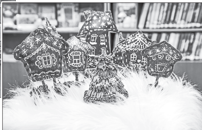
...композиции, иллюстрирующие новогодние сказки...

трансформируя их под текущий сезон и конкретные мероприятия. Это сделает пространство более живым.