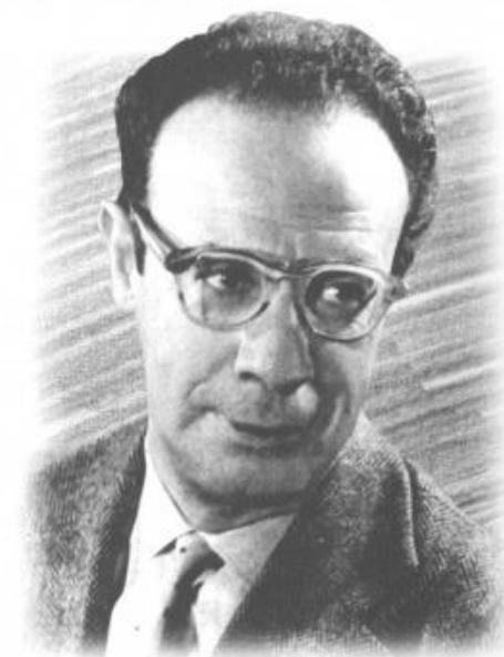
КАССИЛЬ Лев Абрамович 1905–1970