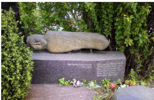
Памятник поэту.